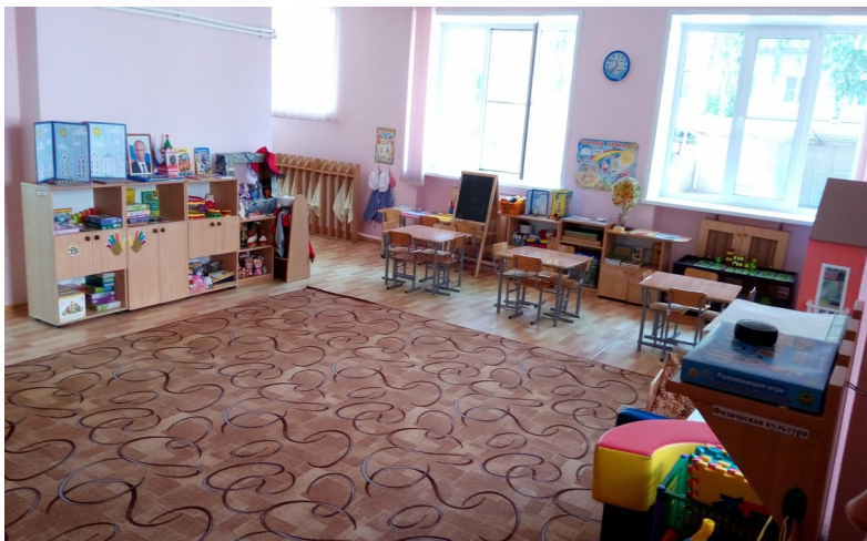
Группа «Солнечные зайчики»