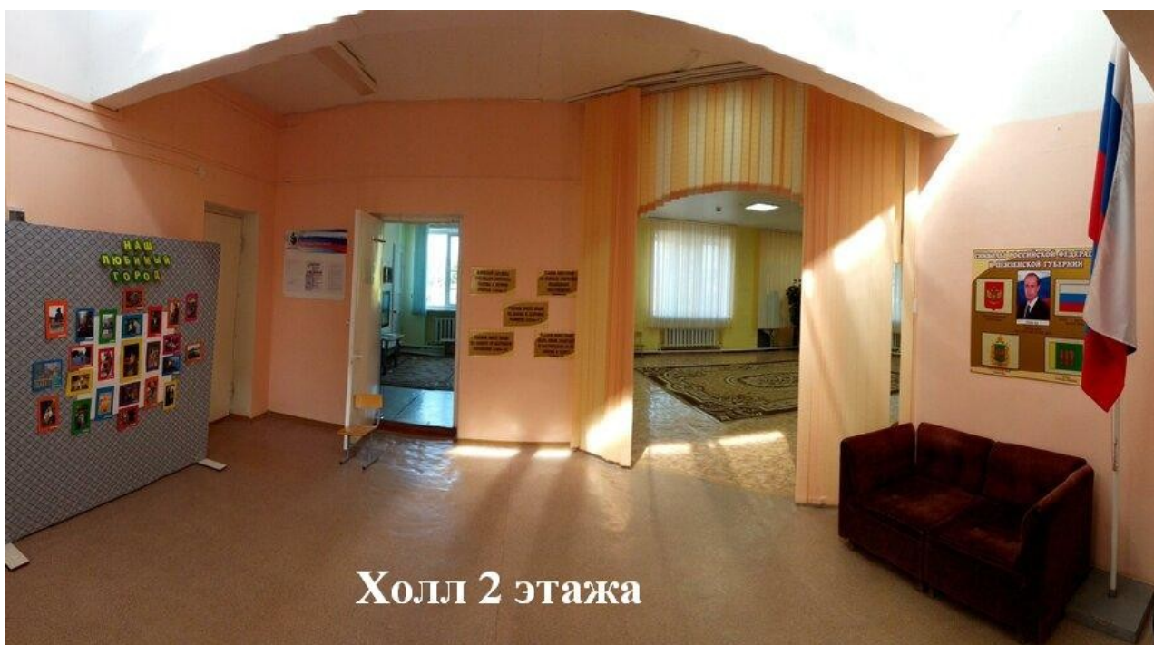
Холл 2 этажа