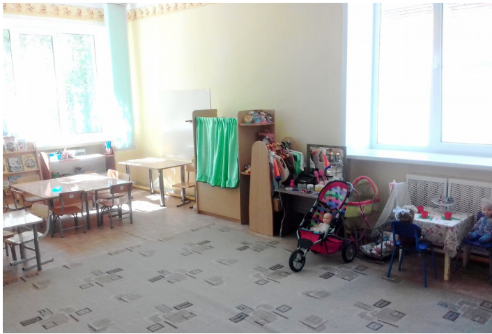
Группа «Солнечные лучики»